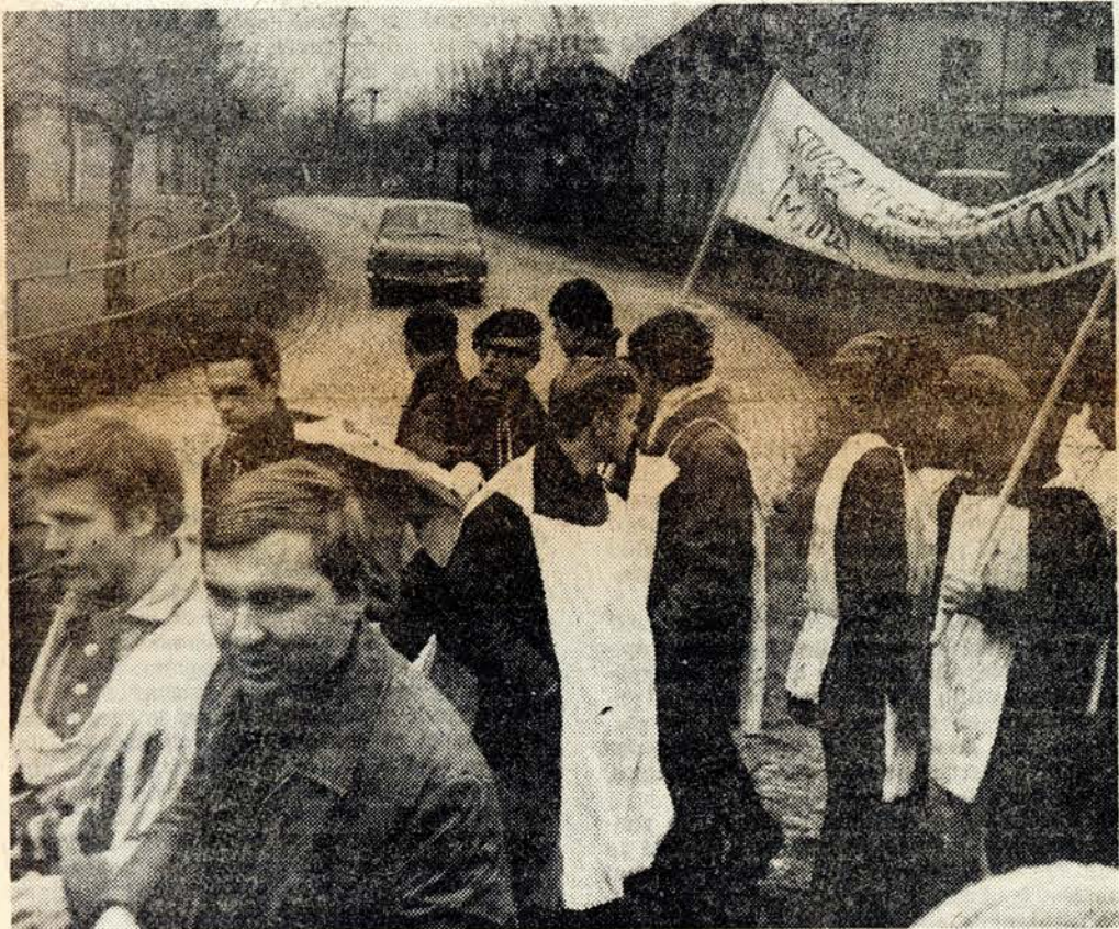
CESTOU DO ČESKÉHO BRODU.